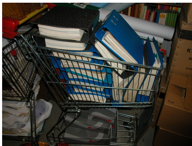
Plecs de documents a l'arxiu ADVN a Anvers, seu del workshop "Archival Awareness".

De la mà de l'Arxiu de Documentació del Nacionalisme Flamenc (ADVFN, en les seves sigles en flamenc, amb seu a Anvers, Flandes), el 2009 es va iniciar el projecte europeu National Movements and Intermediary Structures in Europe (NISE), dedicat a crear una xarxa de centres d'estudi i documentació de les estructures intermèdies del nacionalisme a Europa.